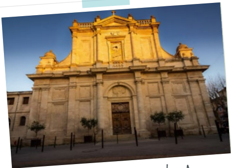
La collégiale Notre Dame des Anges