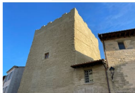
La Tour d'Argent