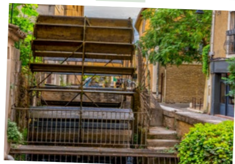
Roue à Aubes